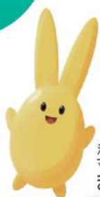
消費生活センター マスコットキャラクター まもりん

悪質商法やニセ電話詐欺など、消費者トラブルの被害防止や暮らしの中での問題や心構え、エコ生活の工夫など消費生活にまつわる川柳を募集します。 安心して暮らせる日常の生活について考えてみませんか。